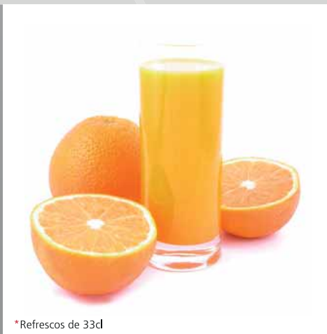
*Refrescos de 33cl